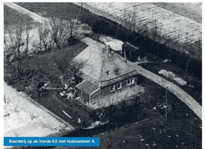
Boerderij op de Vierde Kil met huisnummer 4.

ga ik graag langs al die plekken om te kijken naar de ontwikkelingen. Vooruitgang is goed. Maar ik hoop dat het erfgoed dat we nu nog hebben in stand wordt gehouden voor de volgende generatie."